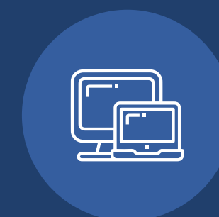
Venta de productos tecnológicos