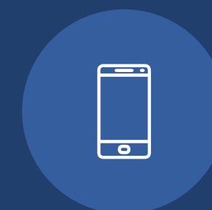
Tecnología y comunicaciones