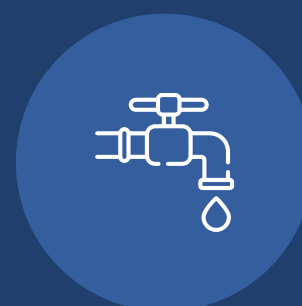
Servicios públicos y TV por cable